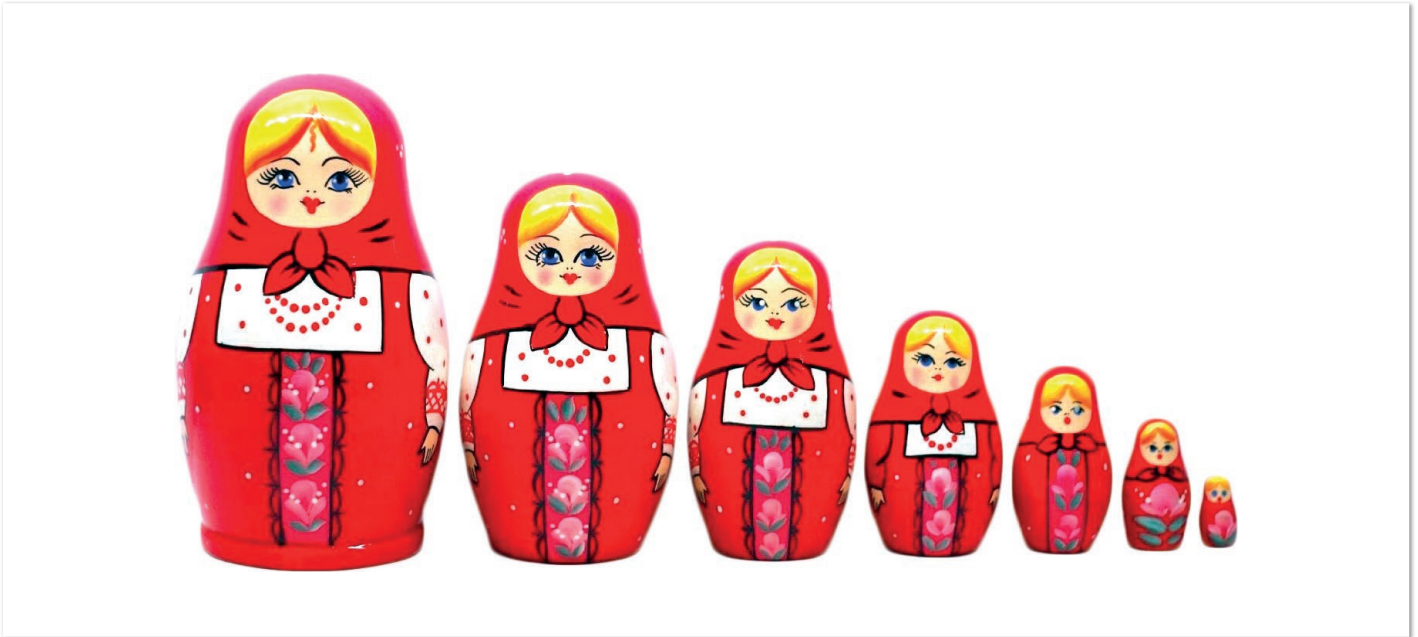
Abbildung 2: Die Matryoschka als Symbol für das Innere Team

dass ihr professionelles Experten-Ich sich von weniger rationalen Gründen ruhigstellen lässt. Doch neben Gründen wie Anerkennung und dem Streben nach Heldentum gibt es auch noch weitere Gründe, die eng miteinander zusammenhängen: fehlender Mut und Angst.